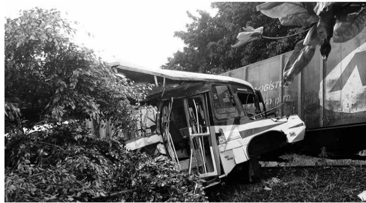
Acidente aconteceu na Rua Presidente Kennedy, em uma localidade conhecida como Vila Rica

Ao todo, 25 pessoas estavam no ônibus sendo duas monitoras, o motorista e 22 crianças. Após a ocorrência um grande aparato de socorro foi encaminhado ao local. Segundo informações de testemunhas, o coletivo foi atingido por um trem de carga ao passar sobre os trilhos. Os feridos receberam os primeiros socorros no local e, na sequência, foram encaminhados a hospitais de Maringá, Apucarana e Londrina. Em nota, a empresa Rumo lamentou a tragédia e informou que está colaborando com as autoridades.