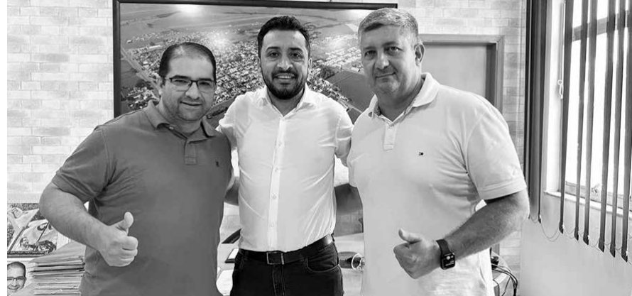
O deputado Adriano José (no centro, de camisa branca) faz a entrega dos novos veículos da prefeitura de Floresta

O deputado estadual Adriano José, líder do Partido Progressista (PP) na Assembleia Legislativa do Paraná e presidente da Comissão de Segurança Pública, acaba de tornar-se o novo parceiro da prefeitura de Floresta, ao lado de deputados estaduais e federais de diferentes partidos que têm ajudado o município com recursos estaduais e federais por meio de emendas. Na semana passada ele esteve na cidade para entregar dois carros zero quilômetro para atender necessidades de certos setores da municipalidade.