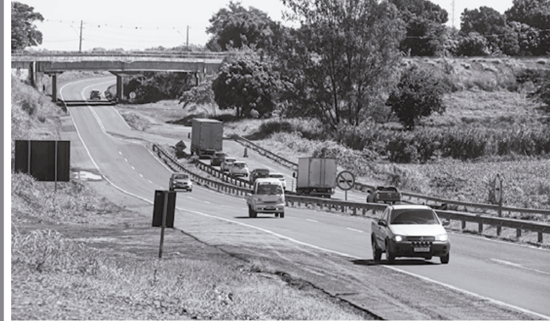
Estreitamento repentino da pista causa acidentes e lentidão no trecho

As forças de segurança do Paraná registraram um total de 132 toneladas de maconha confiscadas nos primeiros cinco meses do ano. O número é 64% maior do que o registrado no mesmo período de 2022 (80 toneladas). O maior registro mensal foi registrado no mês de maio, quando as polícias Civil e Militar apreenderam 53,5 toneladas.