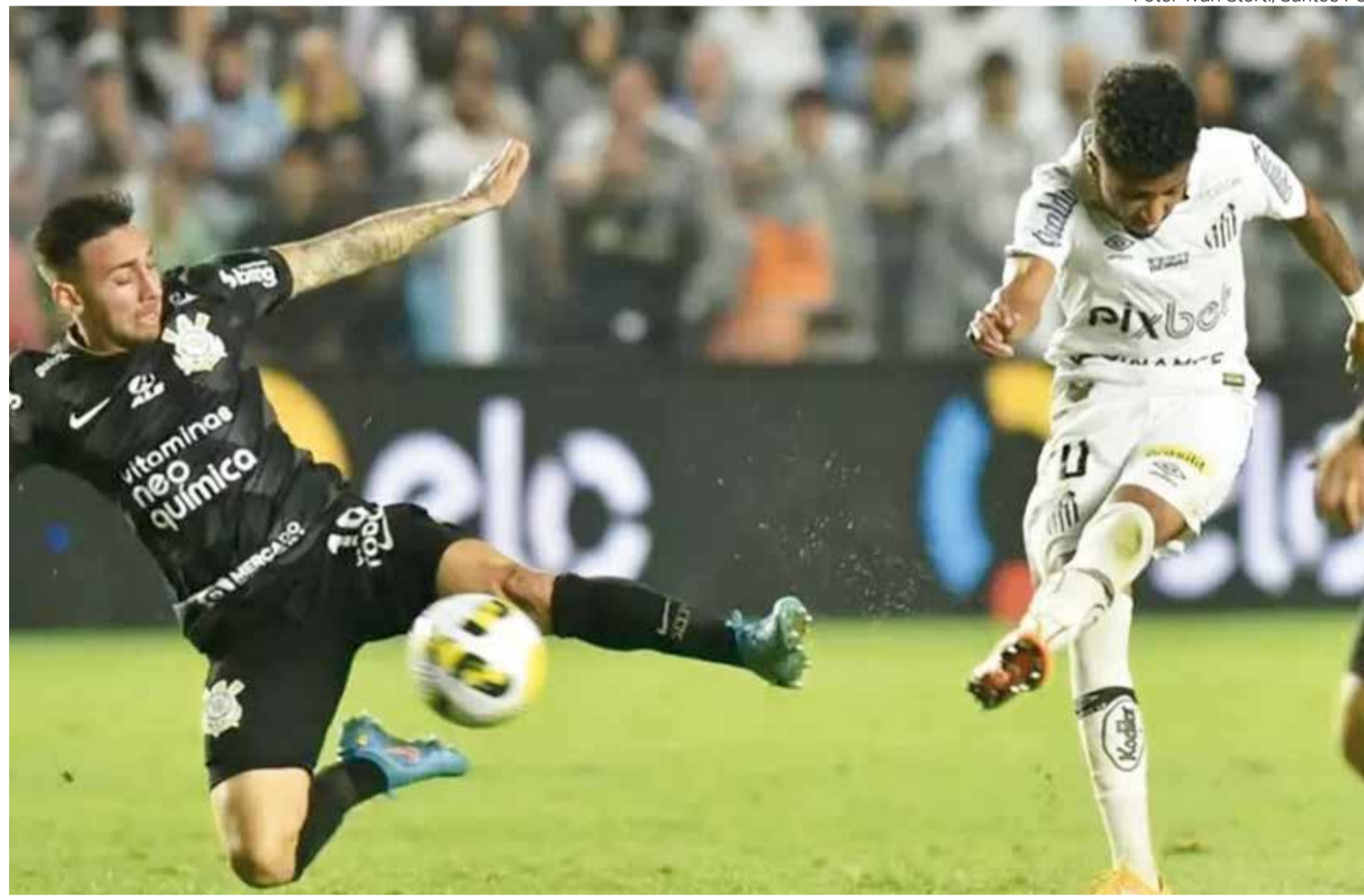
CLÁSSICO – Santos e Corinthians se enfrentam na Vila Belmiro em duelo para a reabilitação das equipes no Campeonato Brasileiro