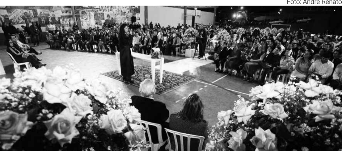
Casais de várias cidades participam dos casamentos comunitários do Tribunal de Justiça

Luiz de Carvalho redacao@omaringa.com.br