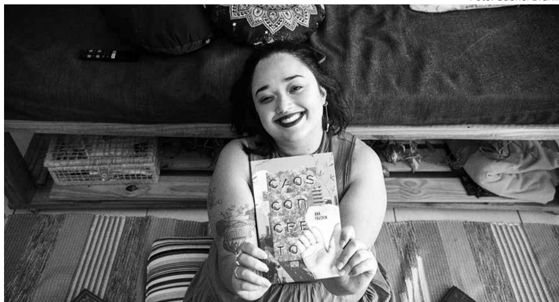
"Caos de Concreto" é resultado de uma trajetória de dez anos

E a oficina Escrita do Ordinário, dia 24 de junho, das 14h30 às 17h30, na Biblioteca Municipal Centro (Av. Ad-