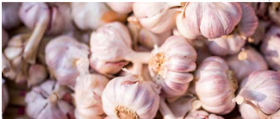
Em Maringá, o alho registrou alta de 10,53% no mês de maio

Cristiano Martinez redacao@omaringa.com.br