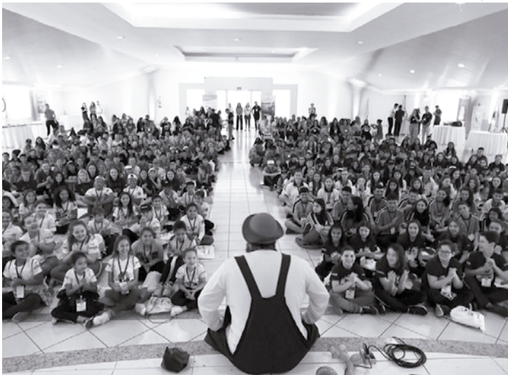
Nos encontros de cooperativas mirins, Dia C é dia de cooperar, mas também de brincar, fazer amizades, conhecer novas ideias

Na próxima semana acontece o Dia do Cooperativismo, que em todo o Brasil é festejado pelas cooperativas de todos os segmentos com o Dia de Cooperar, o chamado Dia C. O Sicoob Metropolitano, por exemplo, vai marcar a data reunindo cerca de 500 crianças de várias cidades em um encontro de cooperativas mirins, no próximo dia 30, em Campo Mourão.