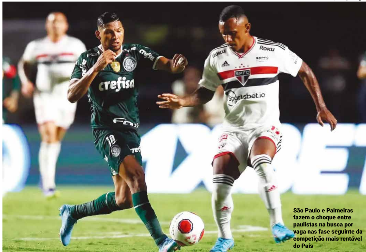
São Paulo e Palmeiras fazem o choque entre paulistas na busca por vaga nas fases seguintes da competição mais rentável do País