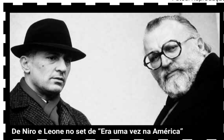
De Niro e Leone no set de "Era uma vez na América"

Henry Fonda, em seu primeiro papel como vilão no ci-