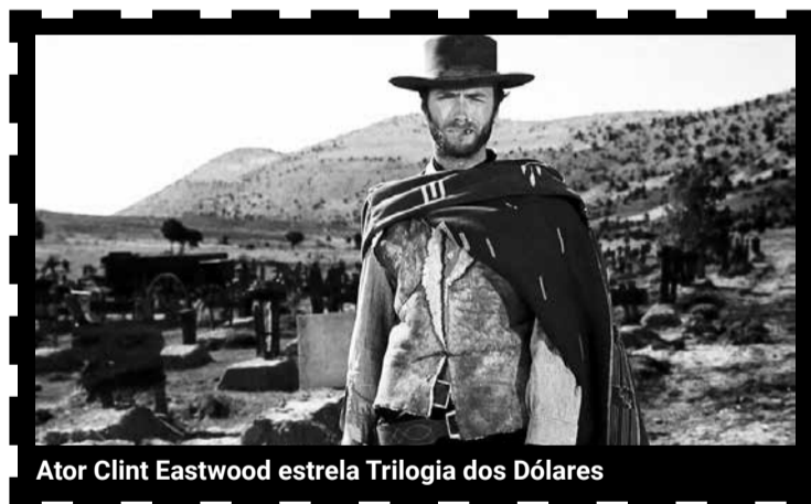
Ator Clint Eastwood estrea Trilogia dos Dólares

Uma das opções é a chamada "Trilogia dos Dólares" dos anos de 1960, formada por um estilo que sedimentou o "western spaghetti", ou seja, as produções italianas que tomaram de assalto o banguê-banguê para dar outra cara, revolucionando o gênero.