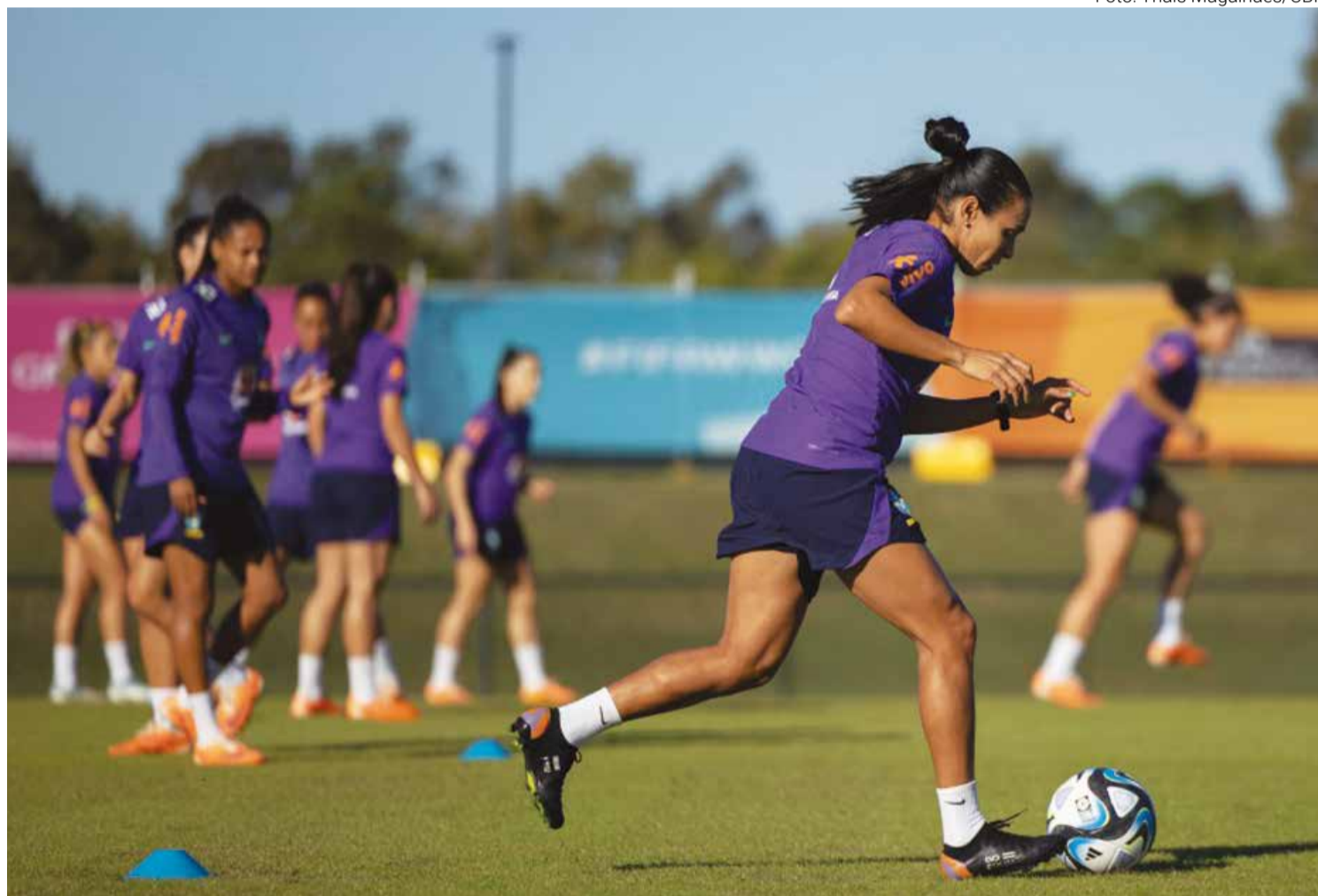
A Rainha Marta, que não deve começar jogando, durante treino da seleção em Brisbane visando estreia no Mundial de Futebol Feminino