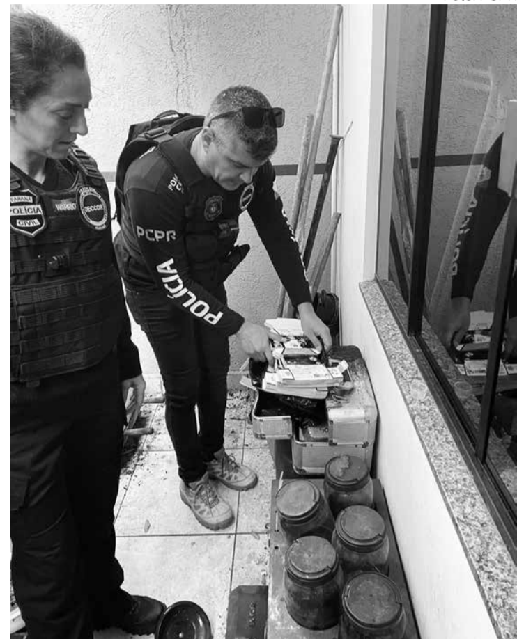
Operação foi deflagrada nesta sexta-feira

Em 2021, uma ação semelhante da PF descobriu em Maringá uma fábrica de falsificar cartuchos de impressora. A investigação da polícia contou com apoio de policiais do Mato Grosso que descobriram naquele estado que cartuchos falsificados na cidade eram entregues a órgãos públicos do norte do Brasil.