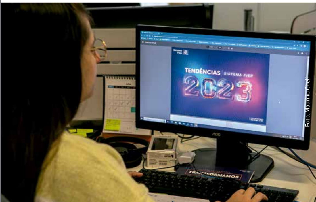
Publicação está disponível gratuitamente para consulta no site do Observatório

Tendências Sistema Fiep 2023 está disponível em formato e-book gratuitamente no site obshub.com.br/pub/tend/tendencias-2023.pdf .