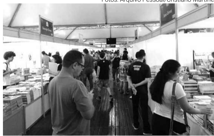
Para a edição de 2023, a Flim retorna aos arredores do Estádio Willie Davids

Em 2023, o tema escolhido para a Flim é "10 edições, uma jornada". A organização e investimento são da Prefeitura de Maringá, sob a responsabilidade da Secretaria Municipal de Cultura (Semuc). O objetivo do evento é