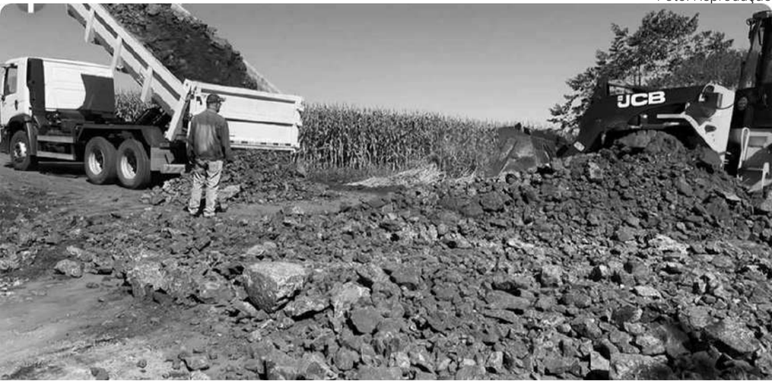
Cascalhamento da Estrada Santo Antonio está chegando ao final

Aproveitando o período do inverno, quando as chuvas raramente, a prefeitura de Floresta iniciou a recuperação de toda a malha viária do município, fazendo o levantamento e cascalhamento das estradas vicinais e coletoras. As obras vão acontecer até a volta da temporada chuvosa, no último trimestre do ano.