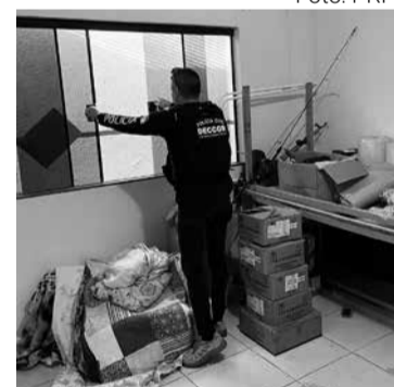
a PRF, a droga apreendida está avaliada em mais de R$ 15 milhões. (Da Redação)

Eles receberam voz de prisão e foram conduzidos até a delegacia de Mandaguari. Segundo