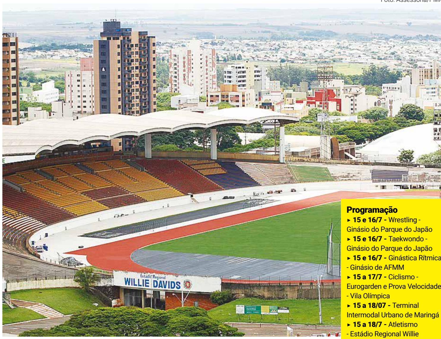
Willie Davids é uma das praças esportivas para o desenvolvimento de modalidades da 69ª edição dos Jeps com sede na Cidade Canção