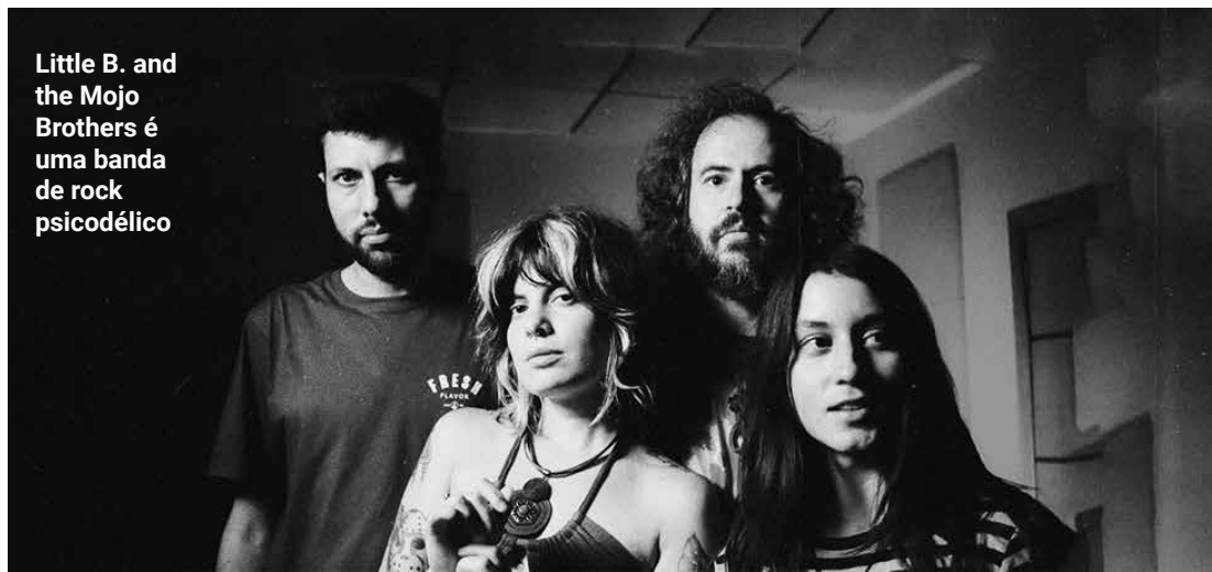
Little B. and the Mojo Brothers é uma banda de rock psicodélico

Há seis anos na estrada, a Little B. and the Mojo Brothers tinha antes um single