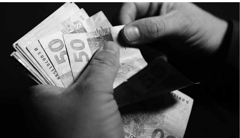
A liberação de parte do 13º significa dinheiro na praça que vai chegar muito além dos servidores

O prefeito de Floresta, Ademir Luiz Maciel, o Dê (PSD), usou suas redes sociais nesta semana para anunciar que já está nas contas bancárias de todos os servidores ativos e inativos da prefeitura metade do 13º salário, praticamente seis meses antes da data obrigatória para o pagamento que é direito de todo trabalhador. Com esta antecipação, cerca de R$ 963 mil estão sendo injetados na economia do município.