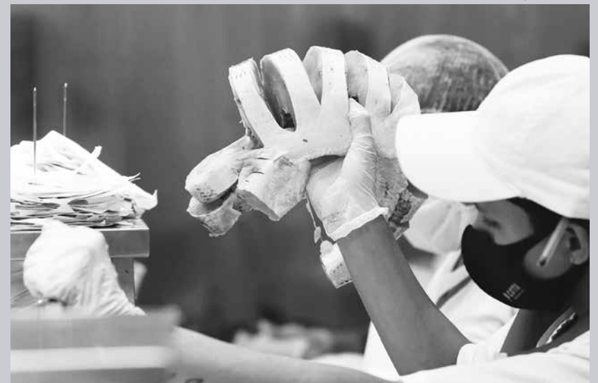
O Paraná responde sozinho por mais de um terço de toda a produção brasileira de tilápias

número crescente de integrados, investimentos em máquinas e equipamentos e implantação de novas linhas de produção. A Cocamar e a Cocari acabam de iniciar projetos na área. Essas cooperativas e empresas já contam com a experiência da produção integrada, abate e exportação adquirida com o frango e suínos. Em 2022, as vendas de carne de tilápia do Paraná para o exterior, sob diferentes formas, atenderam 34 países. Os Estados Unidos foram o principal destino. O mercado pode crescer ainda mais nos próximos anos com a tendência de que o consumo de peixes mais caros seja substituído pelo da tilápia, especialmente em economias atingidas por surtos inflacionários, como as europeias.