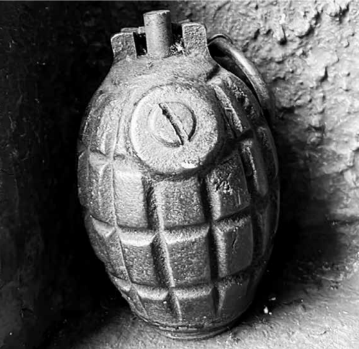
Artefato pode ter sido fabricado em outro continente, existiu por décadas, mas a história acabou dois dias depois de chegar a Sarandi