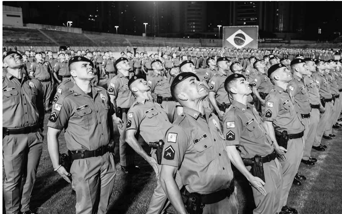
Solenidade ocorreu no Estádio Willie Davids, em Maringá

vos soldados passaram por um treinamento constituído de 50 disciplinas teóricas e práticas, como legislação, defesa pessoal e tiro policial, tática de confronto armado e gerenciamento de crises, entre outras, visando a capacitação para o exercício da atividade policial militar.