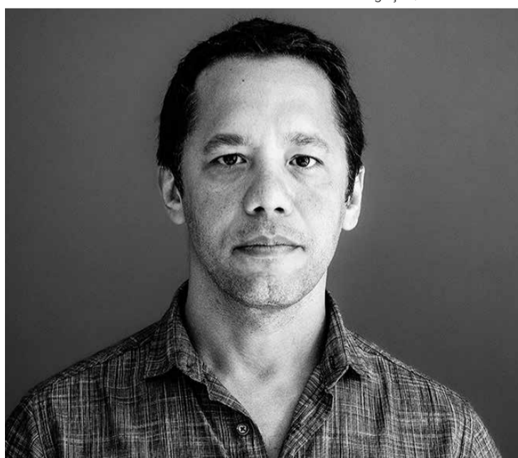
Escritor vem à Cidade Canção para conversar sobre literatura e realidade brasileira

Seu romance "Torto Arado" é um dos maiores sucessos - de público e crítica - da literatura brasileira das últimas décadas, tendo sido traduzido em mais de 20 países e vendido acima de 700 mil exemplares. Já alguns veículos de comunicação estimaram em 2023 que as