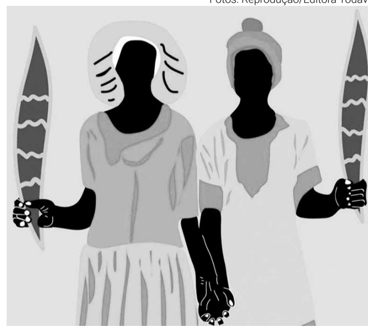
Capa de "Torto Arado" é uma produção de Elisa v. Randow e Aline Bispo

Num diálogo permanente com nossas questões sociais e a tradição literária brasileira, Vieira junior enfeixa um conjunto de histórias a um só tempo atuais e calcadas na multiplicidade de culturas que formam o país. Lidas nas sequências, atestam a vitalidade de um escritor que encontra uma boa parcela de inspiração em personagens que desafiam os limites que