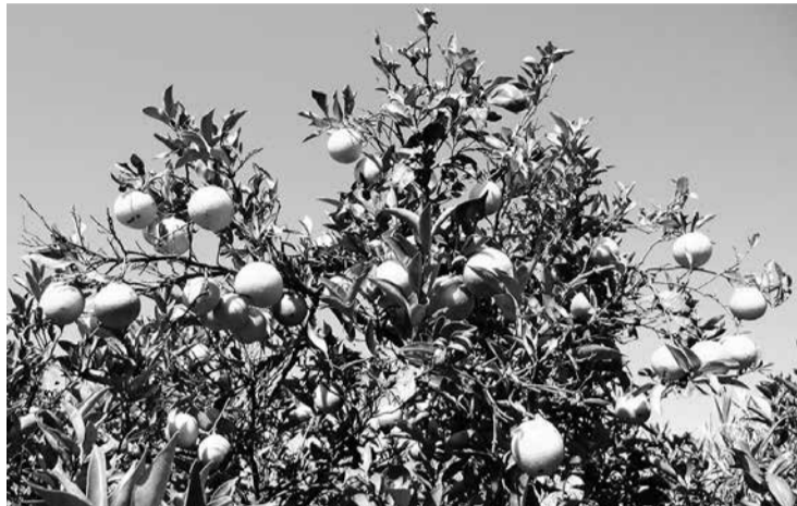
Com alta de 52,11%, laranja pera puxou inflação em Maringá

Em todo o Paraná, as baixas mais significativas foram óleo de soja (-25,74%), fari-