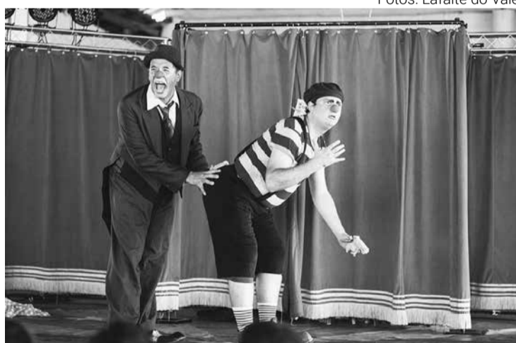
Espectáculo é resultado de pesquisas da companhia londrinense Triolé

Os palhaços apaixonados só conhecem a amada através de uma foto de jornal. E é aí que a dupla arma o circo. Um duelo com armas de água, uma corrida de dois metros rasos, um striptease, uma luta de boxe e até uma aula de balé são algumas das peraltices protagonizadas pelos pretendentes. "Qual a Graça de Laurinda?"