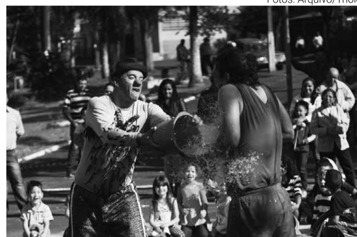
É a história de dois palhaços que disputam o coração de uma palhaça

Nesta edição do projeto, serão 190 apresentações teatrais e