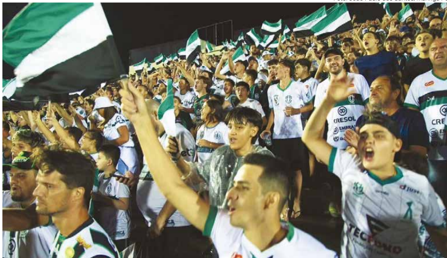
GALERA - Torcida promete apoio para passagem do MFC à terceira fase da Copa do Brasil repetindo feito da temporada anterior