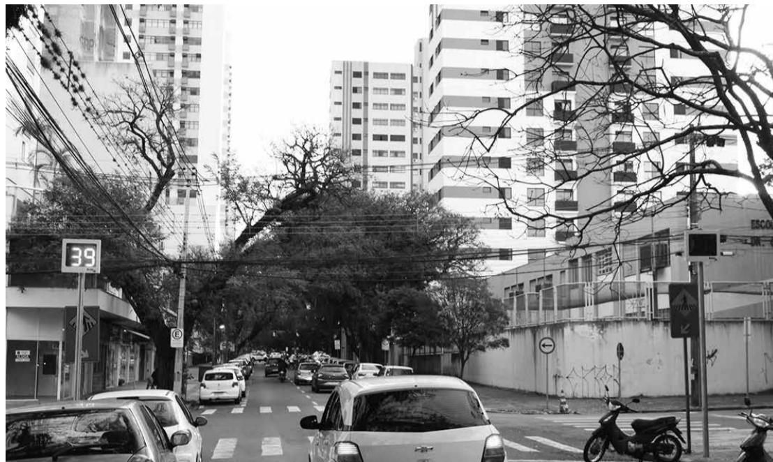
Tráfego em rua central de Maringá onde opera fiscalização por radar