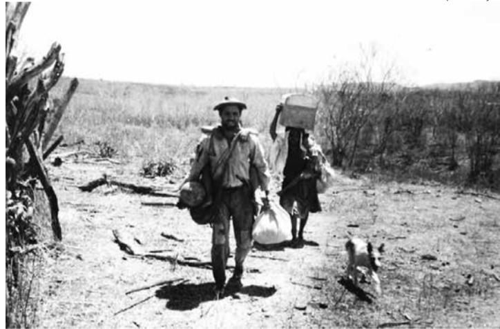
Cena do filme 'Vidas Secas' em adaptação feita por Nelson Pereira dos Santos em 1963

Além de material extraliterário, como é o caso das notas de rodapé contendo: o significado de palavras ou referências não facilmente encontráveis; contextualização de referências históricas; e relações com