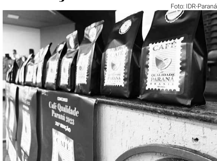
Patrocinadores do concurso receberam os lotes vencedores da edição de 2023

“Queremos estimular o aumento dessa área em mais 20 ou 30 mil hectares, sempre procurando lavouras bem con-