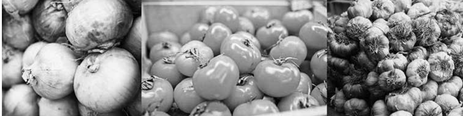
Indicador mostra que as maiores altas mensais ocorreram em cebola, tomate e alho

No caso maringaense, o item com maior baixa também é a batata-inglesa (-21,71%), seguido da maçã (-6,99%) e do contrafilé (-5,72%). Inclusive, o primeiro alimento