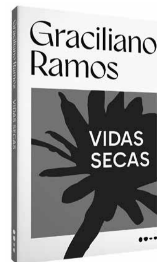
Capa de Kalany Ballardín | Foresti Design para a edição especial da Todavia

mente como contos avulsos, que o autor vendia a conta-gotas para pagar a pensão na qual vivia com a mulher e duas filhas pequenas. Por não terem uma linearidade temporal, podem ser lidos fora de ordem, como contos.