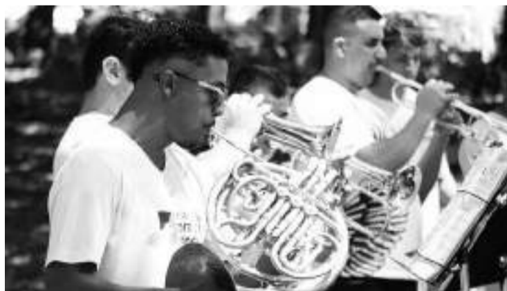
Som da Banda se apresentou no Buracão com o projeto "Música nos Parques"