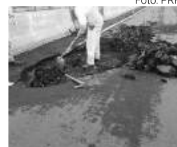
Operários trabalhavam na sexta-feira, 8, em trecho danificado da rodovia

A PRF orientava os motoristas a reduzirem a velocidade e redobram a atenção ao trafegar pelo local, respeitando a sinalização e as orientações dos agentes presentes na via.