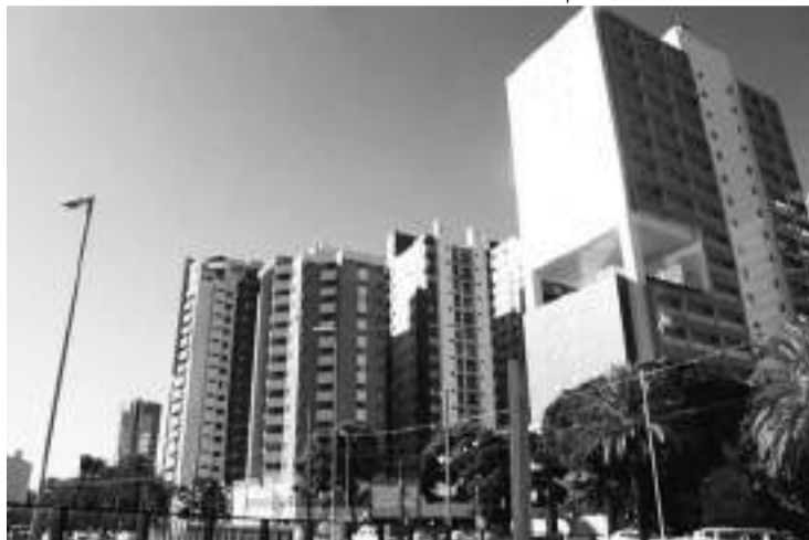
Região central de Maringá. Município mantém a quinta colocação em 2024

Conforme mandamento constitucional, 40% têm destinação obrigatória, sendo 15% obrigatoriamente destinado à Saúde e 25% obrigatoriamente destinado à Educação. O per-