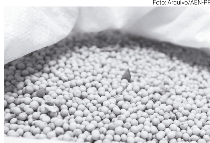
Condições climáticas foram favoráveis, principalmente no Paraná, em Santa Catarina e na maioria dos estados do Centro-Oeste

A Conab aponta para um aumento na produção total de milho, com expectativa de produção chegando a