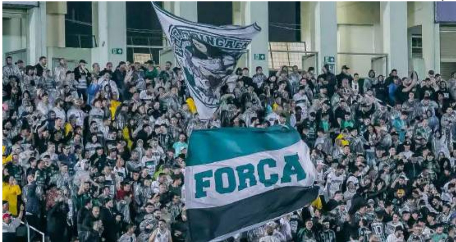
MFC conta com apoio da torcida no WD para jogos pelas quartas de final do Estadual e Copa do Brasil

Da Editoria de Esportes viola@omaringa.com.br