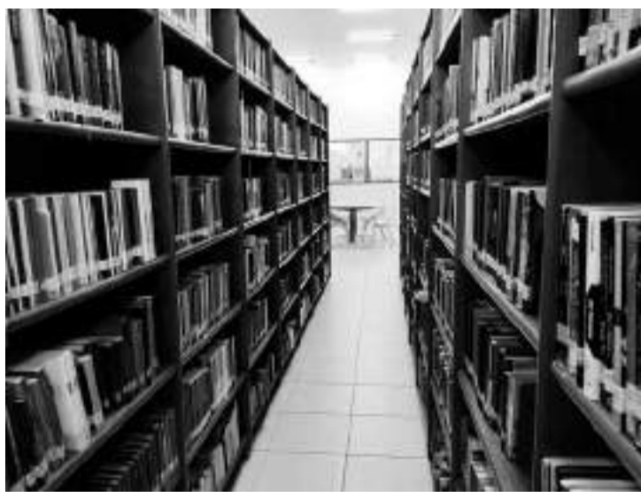
Encontros serão mantidos no espaço da Biblioteca Centro

empresária bem-sucedida, apesar de todos os percalços e aventuras pelos quais passou. A personagem foi inspirada em Luísa Mahin, que teria sido mãe do poeta Luís Gama e participado da célebre Revolta dos Malês, movimento liderado por escravizados muçulmanos a favor da Abolição.