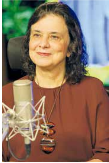
Ministra Nísia Trindade tem vinda confirmada para Maringá

A inauguração será as 10 horas e contará também com a presença de representantes da Liga Álvaro Bahia Contra a Mortalidade Infantil, instituição sem fins lucrativos que administra o hospital, além de prefeitos e secretários de Saúde dos municípios da região noroeste do Paraná, já que a área de abrangência do Hospital da Criança de Maringá en-