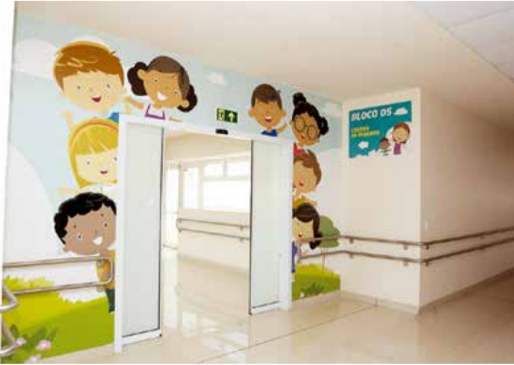
Hospital é fruto de parceria dos governos federal, estadual e municipal e destina 60% de seu atendimento a pacientes do Sistema Único de Saúde (SUS)