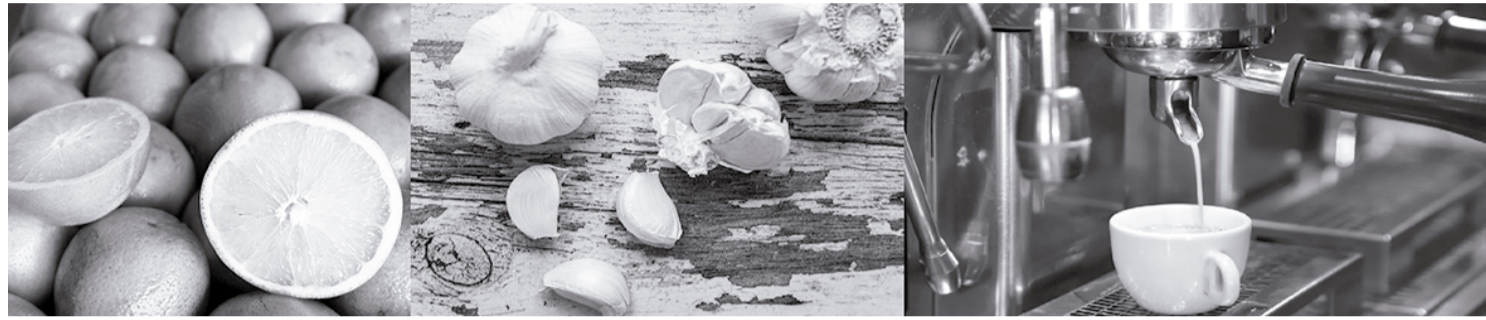
Inflação dos últimos 12 meses em Maringá foi puxada principalmente por laranja-pera, alho e café

“A baixa oferta no mercado interno foi um dos principais