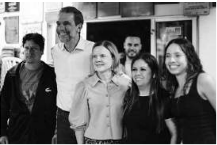
Ministra Gleisi Hoffmann reuniu a imprensa para anunciar o amigo Enio Verri como pré-candidato ao Senado