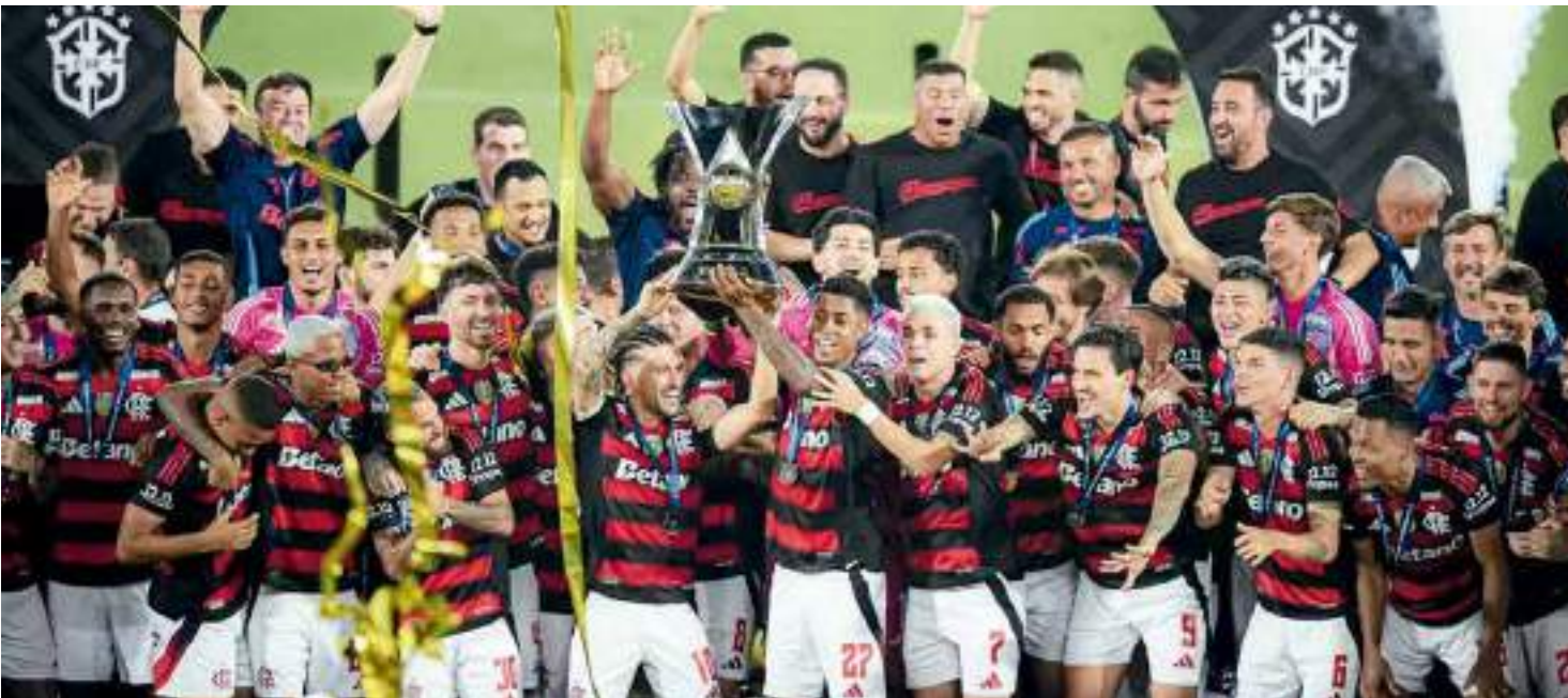
Rubro-negro conquistou título nacional pela 8ª vez com uma rodada de antecedência ao vencer o Ceará por 1 a 0 no Maracanã