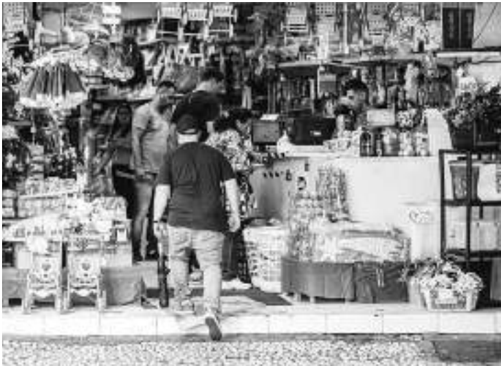
Pesquisa da Fecomércio PR/Sebrae PR revela que os paranaenses estão mais inclinados a presentear neste fim de ano