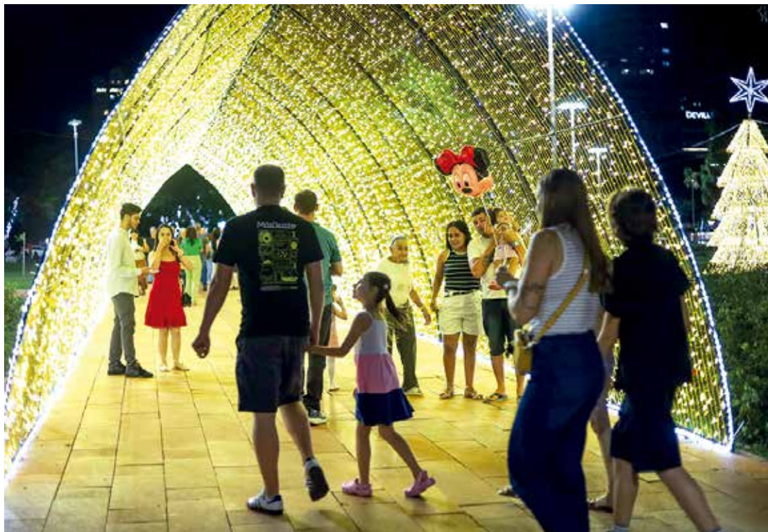
tojuvenil Pequenos Anjos.

Quando o assunto é alimentação, a Vila Gastronômica no canteiro central da Avenida Getúlio Vargas, oferece dezenas de opções até 28 de dezembro, das 17h às 22h de segunda a quinta-feira e até 0h de sexta a domingo. As Vilas do Artesanato, na Avenida Getúlio Vargas e na Praça Raposo Tavares, reúnem peças de mais de 100 artesãos locais até o dia 23 de dezembro, das 17h às 22h.