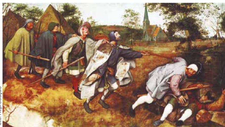
A Parábola dos Cegos (1568). Pieter Bruegel, o Velho

Mas o que se vê com frequência é o oposto: uma confiança inflada que não vem de estudo, mas de familiaridade. Já tocou aquilo antes... Já ouviu aquilo antes... Já improvisou naquele formato antes... E isso gera uma ilusão de compreensão.