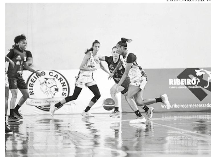
Contra o Santo André, a ADRM Maringá foi bem na defesa; mas acabou sendo derrotada em casa

Após uma sequência “caseira” na abertura do campeonato, a equipe da ADRM Maringá fará seu primeiro jogo fora dos domínios nesta edição da Liga de Basquete Feminino (LBF). Será na próxima quarta-feira, 25, no interior de São Paulo. O time maringaense visitará o Campinas Basquete, no Tênis Clube Campinas.