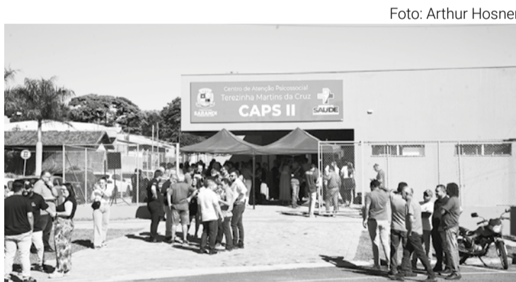
Com oito salas para atendimentos individuais e refeitório, o novo CAPS II de Sarandi é resultado de investimento de R$ 2,2 milhões

O espaço dispõe de duas salas voltadas para atividades coletivas, onde serão realizadas oficinas terapêuticas e grupos de acompanhamento,