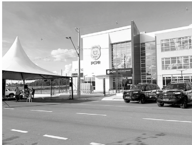
Delegacia Cidadã de Maringá está localizada na Rua Pioneiro Thiago Netto, 331, no Centro Cívico

“Esse é um desejo do governador Carlos Massa Ratinho Júnior, que não mede esforços para tornar possível a criação de espaços dignos,