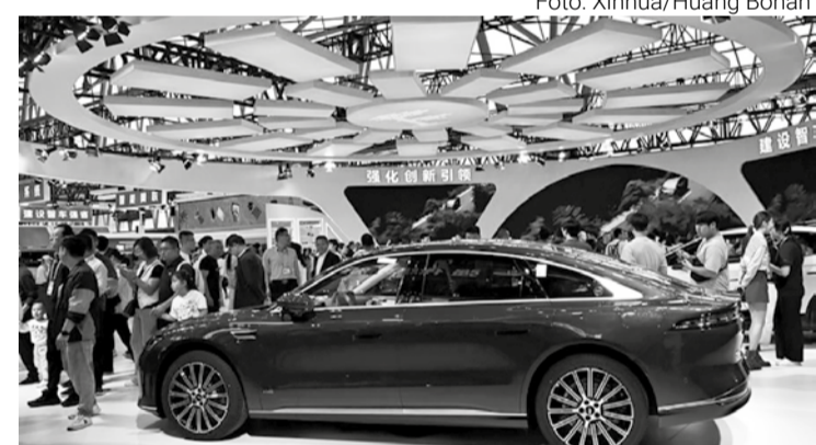
Em 2025, a produção e as vendas de veículos de nova energia totalizaram 16,63 milhões e 16,49 milhões de unidades