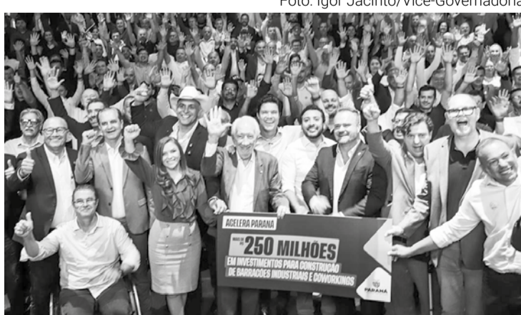
Secretários e prefeitos comemoraram a confirmação de barracões destinados a oferecer espaço para o início de novos empreendimentos

O novo ambiente será estruturado para atender profissionais, empreendedores, estudantes e criadores de ideias, oferecendo espaço adequado para trabalho, troca de experiências e desenvolvimento de projetos. A proposta é transformar o local em um ponto de encontro para inovação e