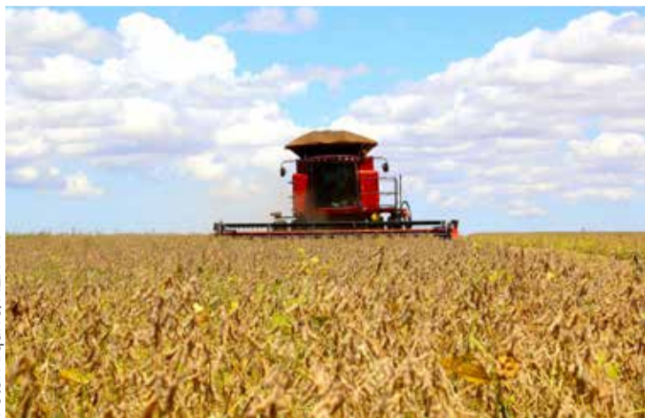
No Paraná, colheita da soja atingiu 70% dos 5,77 milhões de hectares previstos para o ciclo

safra, o cenário é semelhante. Dos quase 341 mil hectares plantados, cerca de 83% já foram colhidos. Na safra passada, nesse mesmo período, a colheita ultrapassava os 90% da