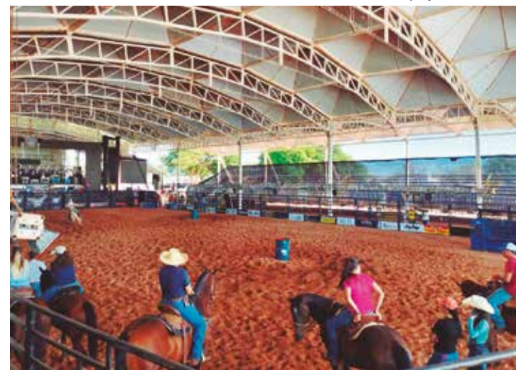
A arena coberta contará com as provas de rodeio e praça de alimentação