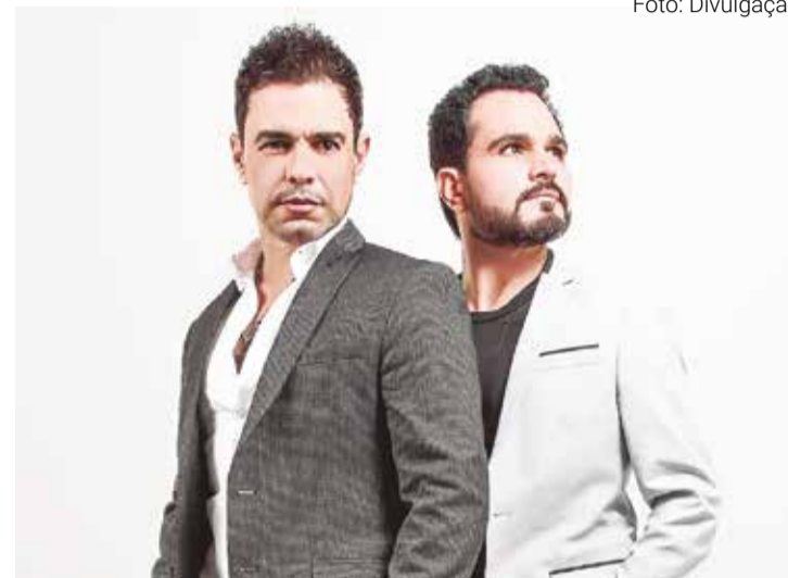
Zezé di Camargo e Luciano vão comandar um grande coral formado pelo público ao apresentar seus maiores sucessos