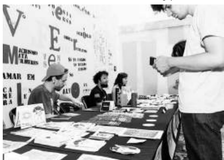
Expositores disponibilizarão materiais para venda, troca e distribuição gratuita

O termo zine deriva de fanzine, ou “revista de fãs”, e designa publicações arte-