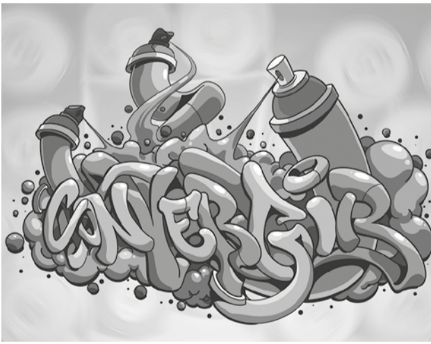
Identidade visual do projeto criada pelos artistas