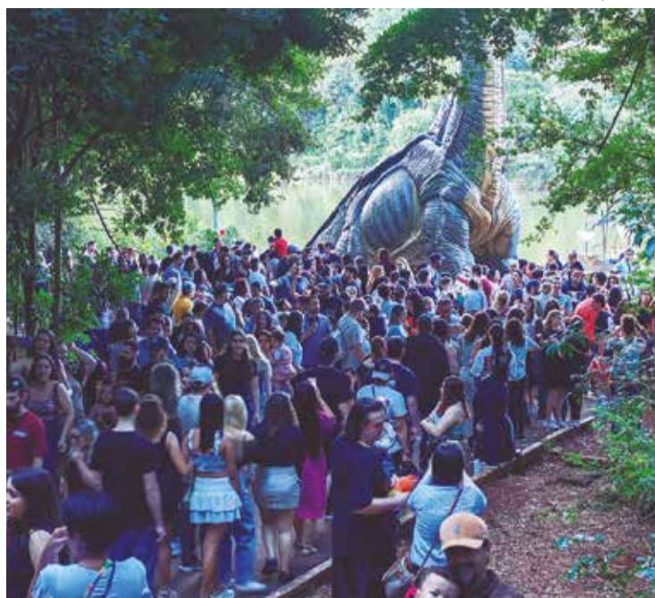
Com recorde de visitação, mostra já atraiu mais de 90 mil visitantes de Maringá, da região e de outros estados ao parque

O prefeito também ressalta o trabalho artístico das peças. “É uma oportunidade de prestigiar obras que exigiram dedicação e tempo de produção. O braquiossauro gigante, por exemplo, levou cerca de um