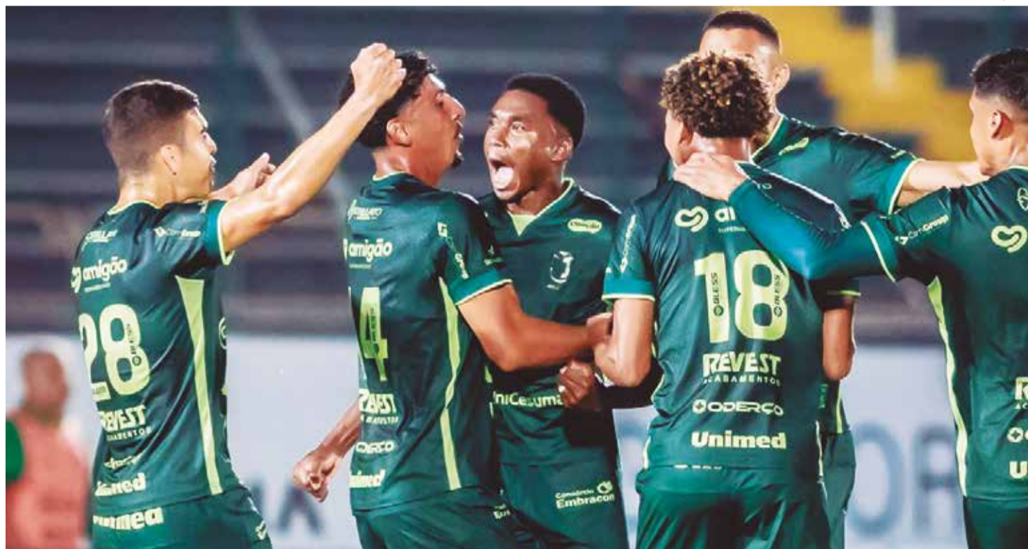
Tricolor conta com apoio a torcida para superar nordestinos nesta segunda-feira, às 19h30, pela terceira divisão nacional